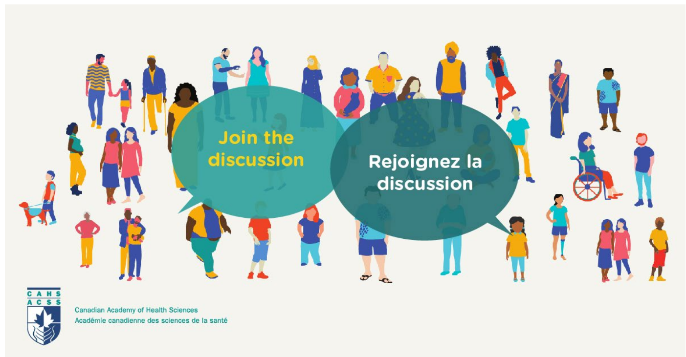
Figure 1. Rejoignez la discussion. Exemple d'infographie diffusée dans les médias sociaux.

Nous avons invité les participants à prendre part à un processus de consultation des parties prenantes qui a duré sept mois en 2021 et leur a permis de participer de diverses manières. La diffusion des renseignements relatifs aux consultations s'est effectuée par de multiples canaux de communication, notamment le courrier électronique, le site Web de l'ACSS, les affichages et les annonces dans les médias sociaux, le bouche-à-oreille et les communiqués de presse (la figure 1 présente un exemple d'infographie diffusée dans les médias sociaux). Des renseignements sur le processus et sur la façon de participer ont été envoyés par courriel à plus de 800 parties prenantes (organismes et particuliers). Vous trouverez ci-dessous de plus amples renseignements sur la communication et le recrutement concernant chaque plateforme destinée aux parties prenantes.