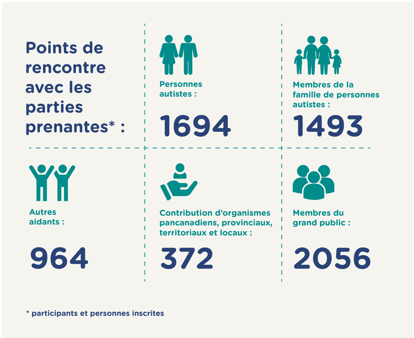
Figure 3 : Points de rencontre avec les parties prenantes par groupe de participants

Au cours du processus de consultation, des mesures ont été prises afin d'inclure et de donner la parole à des personnes qui n'avaient pas été prises en compte lors des consultations et des travaux de recherche précédents. Par exemple, le sondage pancanadien a suréchantillonné les personnes autistes 2SLGBTQIA+, des groupes de discussion ont été spécialement organisés